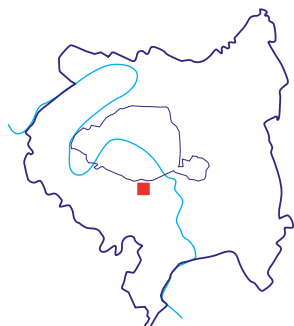
Site «Inventons la Métropole du Grand Paris». Secteur de la gare Kremlin-Bicêtre-Hôpital

Rue Gabriel Péri, rue Séverine 94270 Le Kremlin- Bicêtre